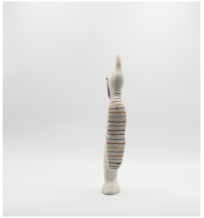
19- SANS TITRE, 2024 Grés basse température, engobe, email 30x12x4 cm