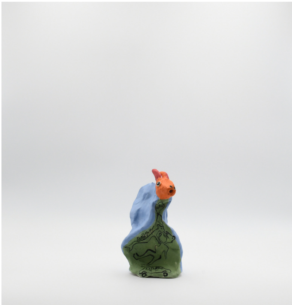
5- LAPIN ETOURDI, 2024 Grés basse température, engobe, email 17x10x7cm