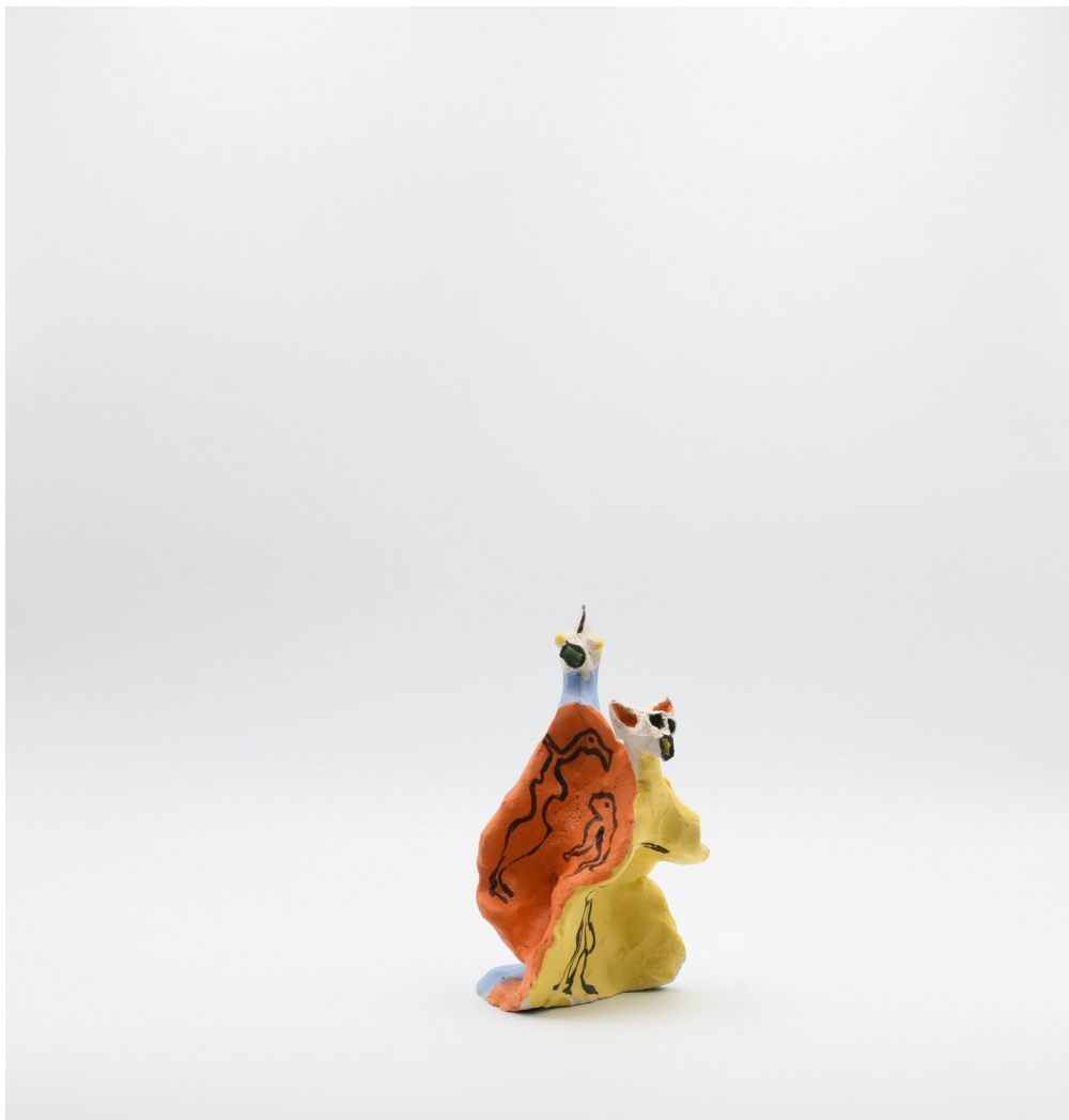
11- SANS TITRE, 2024 Grés basse température, engobe, email 16x9x15 cm