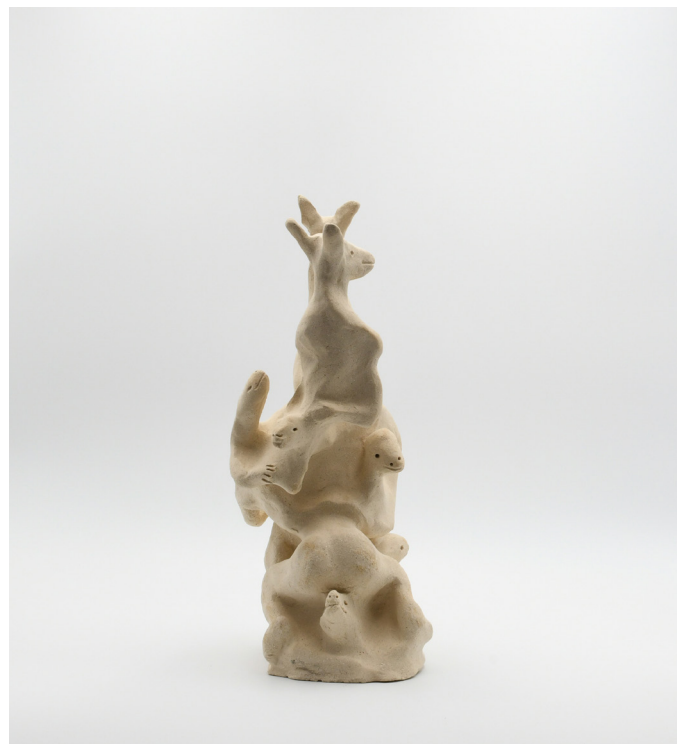
20- serie IRREALITÉ, 2024 Grés 29x16x15 cm