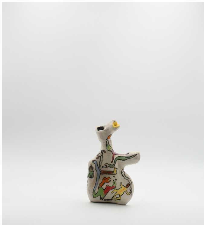
7- MIROUNGA, 2024 Grés basse température, engobe, email 18x20x13 cm