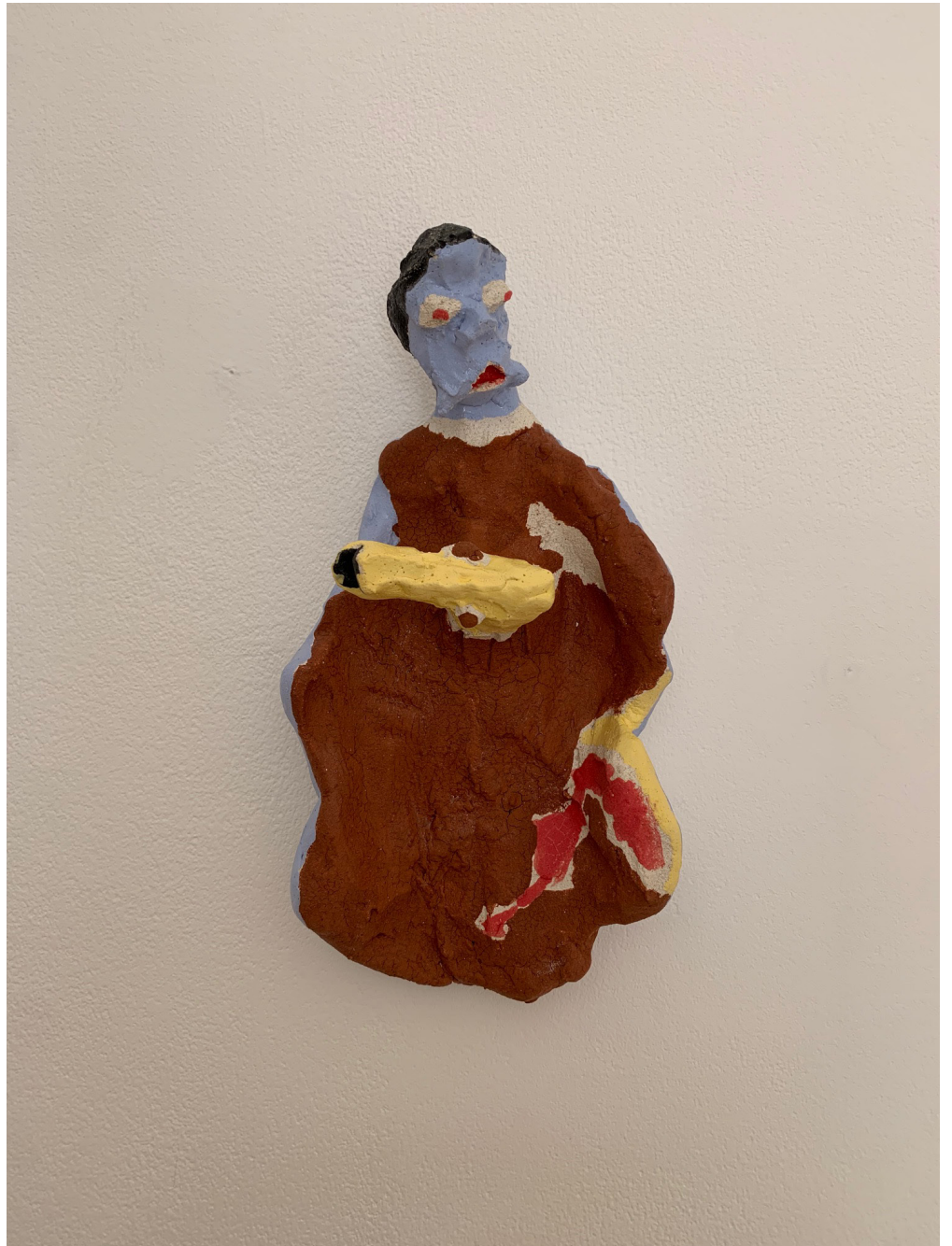
24- L'ACCOUCHEMENT, 2024 Grés basse température, engobe, email 31x10x3 cm