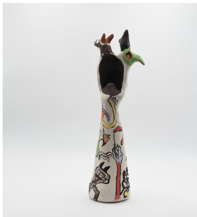
8- CASE AUX OISEAUX ET ANIMAUX, 2024 Grés basse température, engobe, email 38x13x10 cm