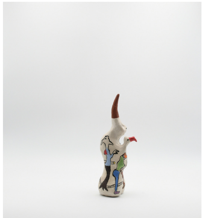
16- L'HOMME PINGOIN , 2024 Grés basse température, engobe, email 22x9x7 cm