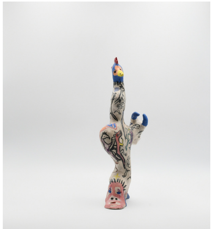
18- COQ A DOUBLE TÊTE, 2024 Grés basse température, engobe, email 31x15x7 cm