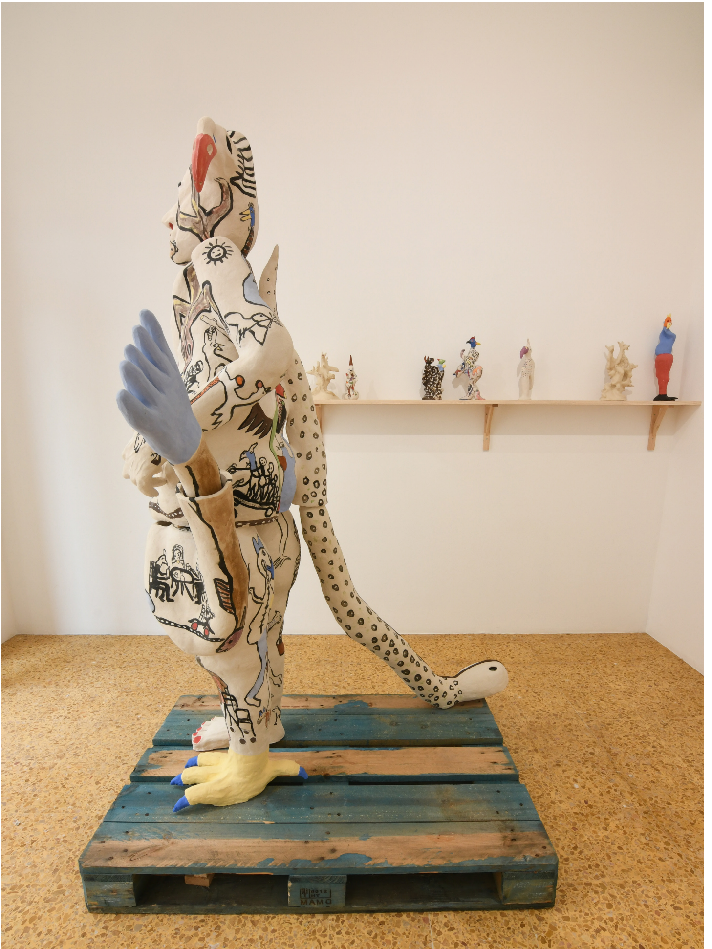
Vues de l'exposition Le traversé, Benjamin Deguenon du 28 juin au 31 août 2024, Terrail, espace de céramique et art contemporain à Vallauris