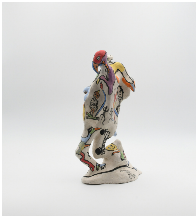
4- TRANSCENDANCE, 2024 Grés basse température, engobe, email 30x18x15cm