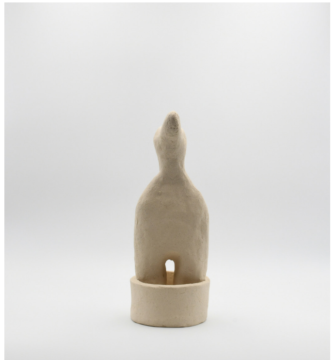
10- GROS-BB, 2024 Grés 28x12x11 cm