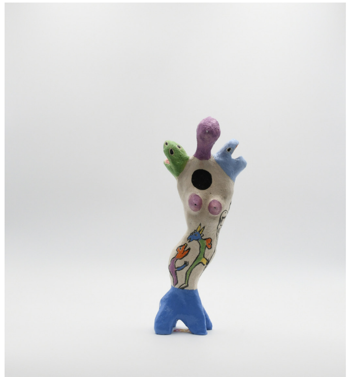
1- FEMME A TROIS TÊTES , 2024 Grés basse température, engobe, email 28x13x6 cm