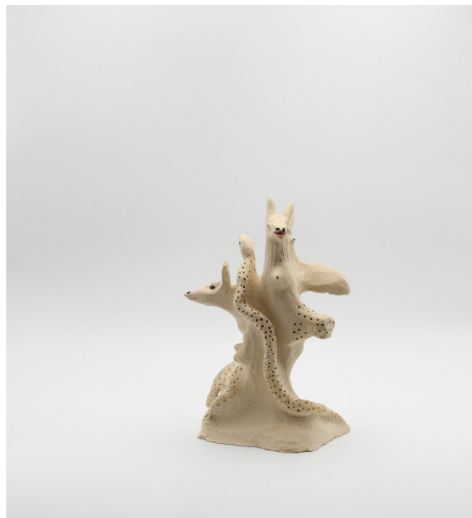
15- serie IRREALITÉ, 2024 Grés 24x18x12 cm