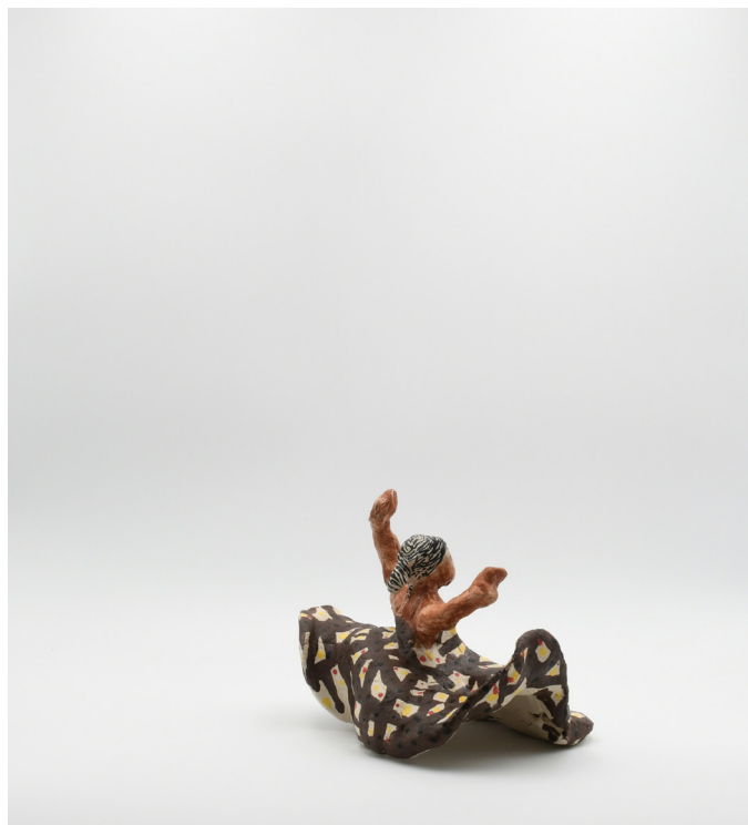
14- DANSEUSE, 2024 Grés basse température, engobe, email 15x18x16 cm