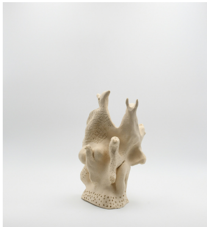
9- serie IRREALITÉ, 2024 Grés 24x21x16 cm