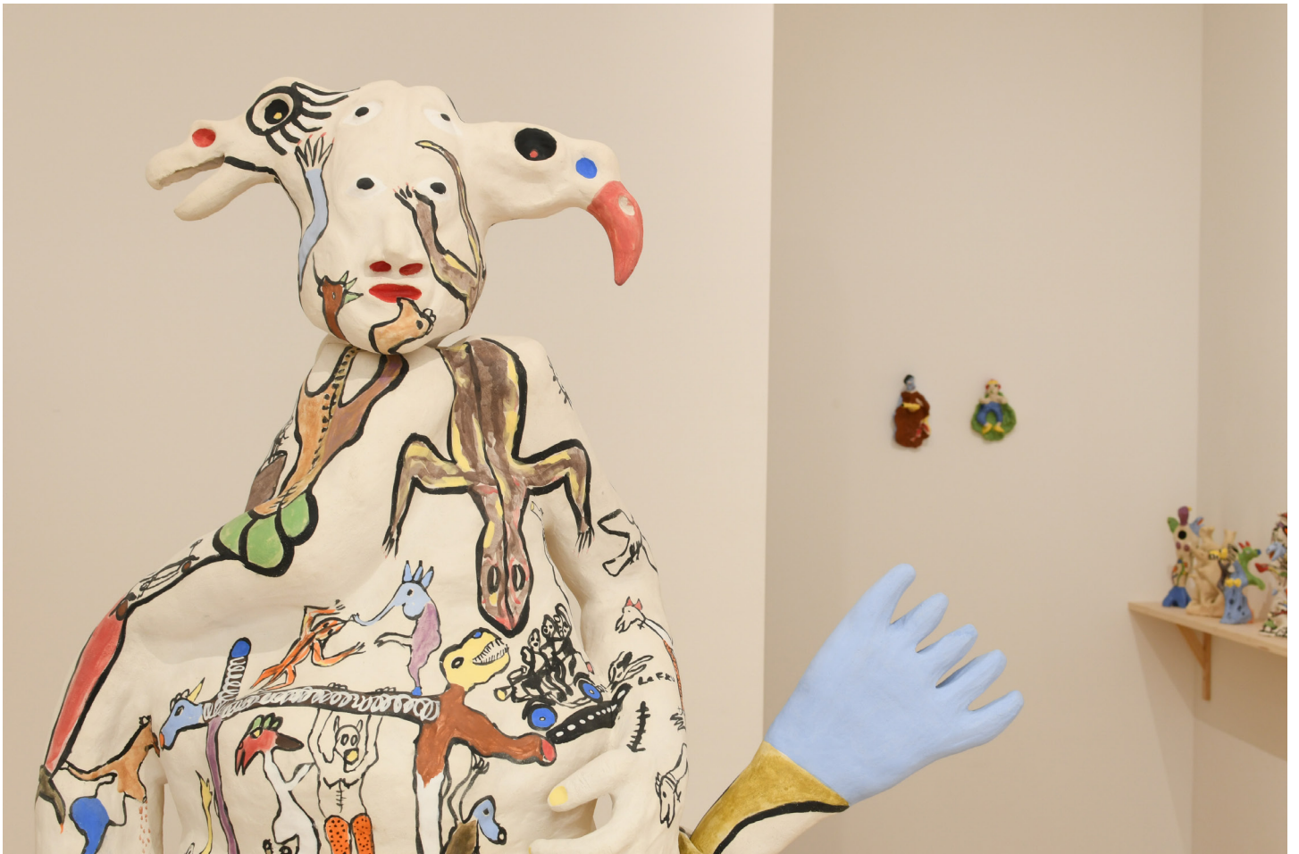
Vues de l'exposition Le traversé, Benjamin Deguenon du 28 juin au 31 août 2024, Terrail, espace de céramique et art contemporain à Vallauris