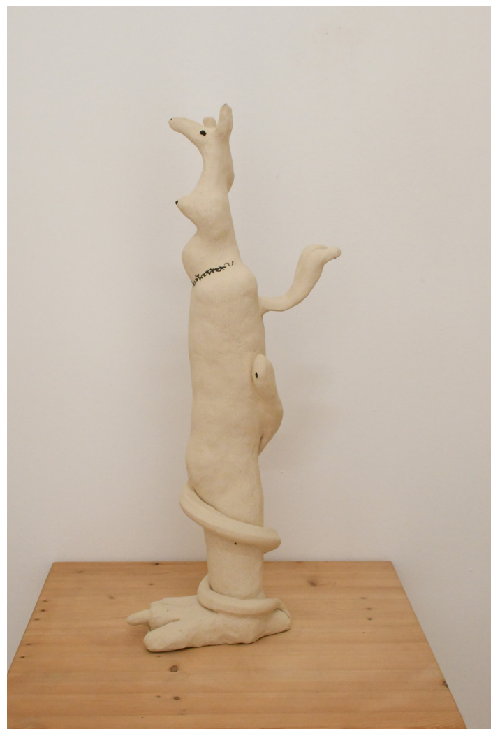
22- REINE-MÈRE, 2024 grés 60x26x13 cm