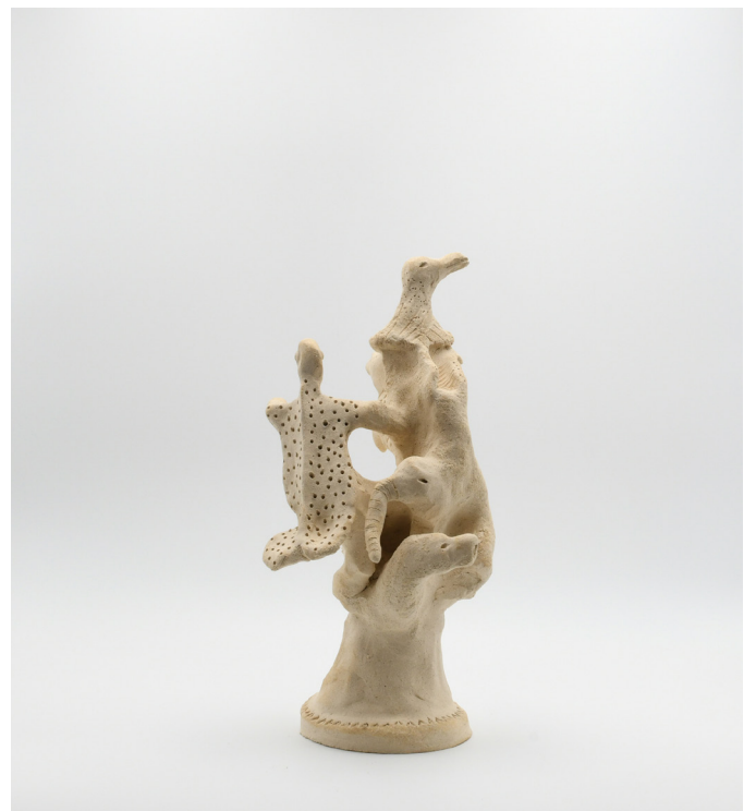
6- serie IRREALITÉ, 2024 Grés 29x19x15cm