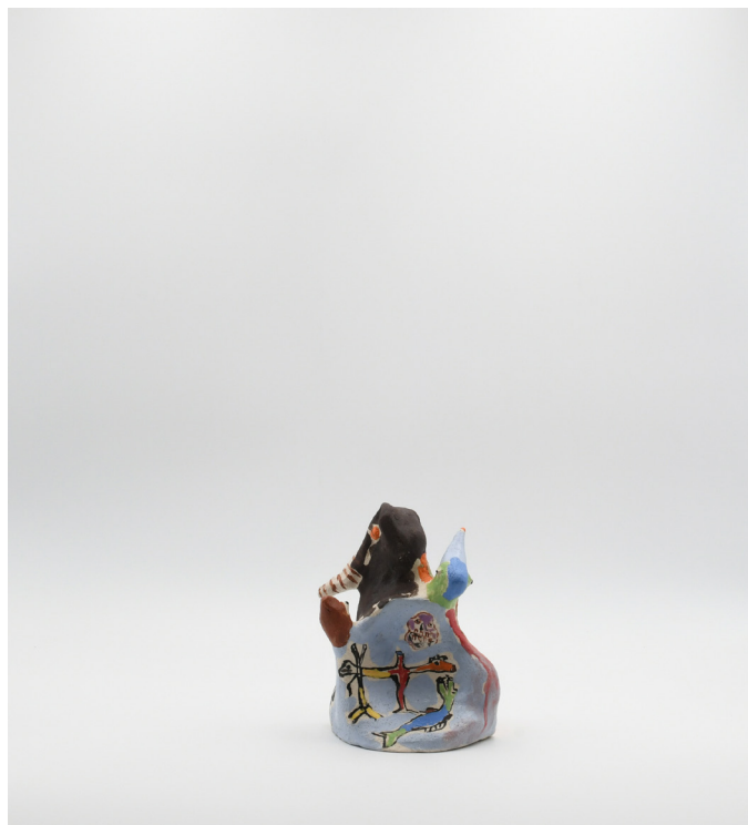
12- L'ÉLEPHANT D'AFRIQUE, 2024 Grés basse température, engobe, email 13x11x10 cm