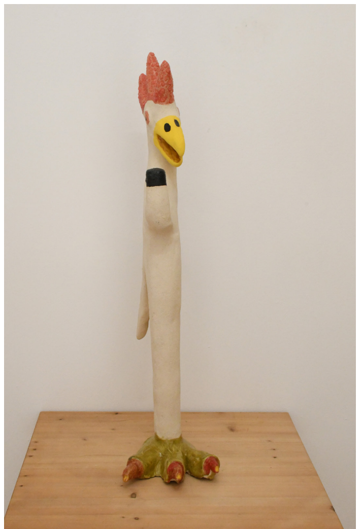
23- L'HOMME A COQ 2, 2024 Grés basse température, engobe, email 65x20x17 cm