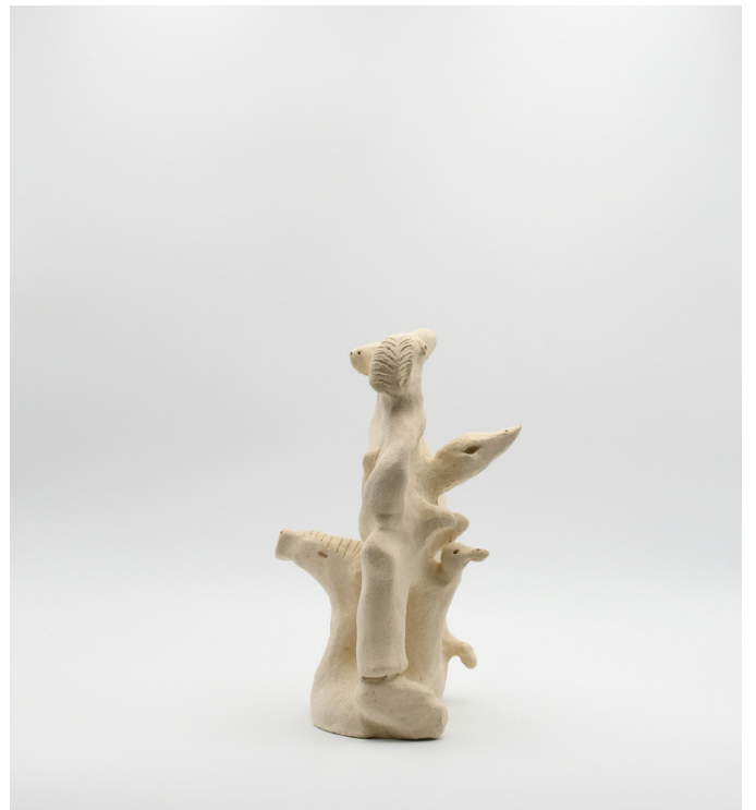
2- serie IRREALITÉ, 2024 Grés 24x16x14 cm