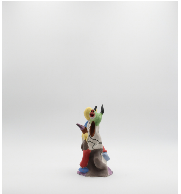
13- serie IRREALITÉ, 2024 Grés basse température, engobe, email 18x12x10 cm