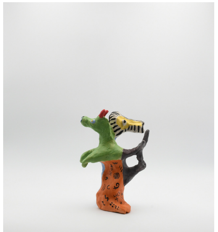
3- MONSTRE A DEUX TETES , 2024 Grés basse température, engobe, email 30x18x15cm