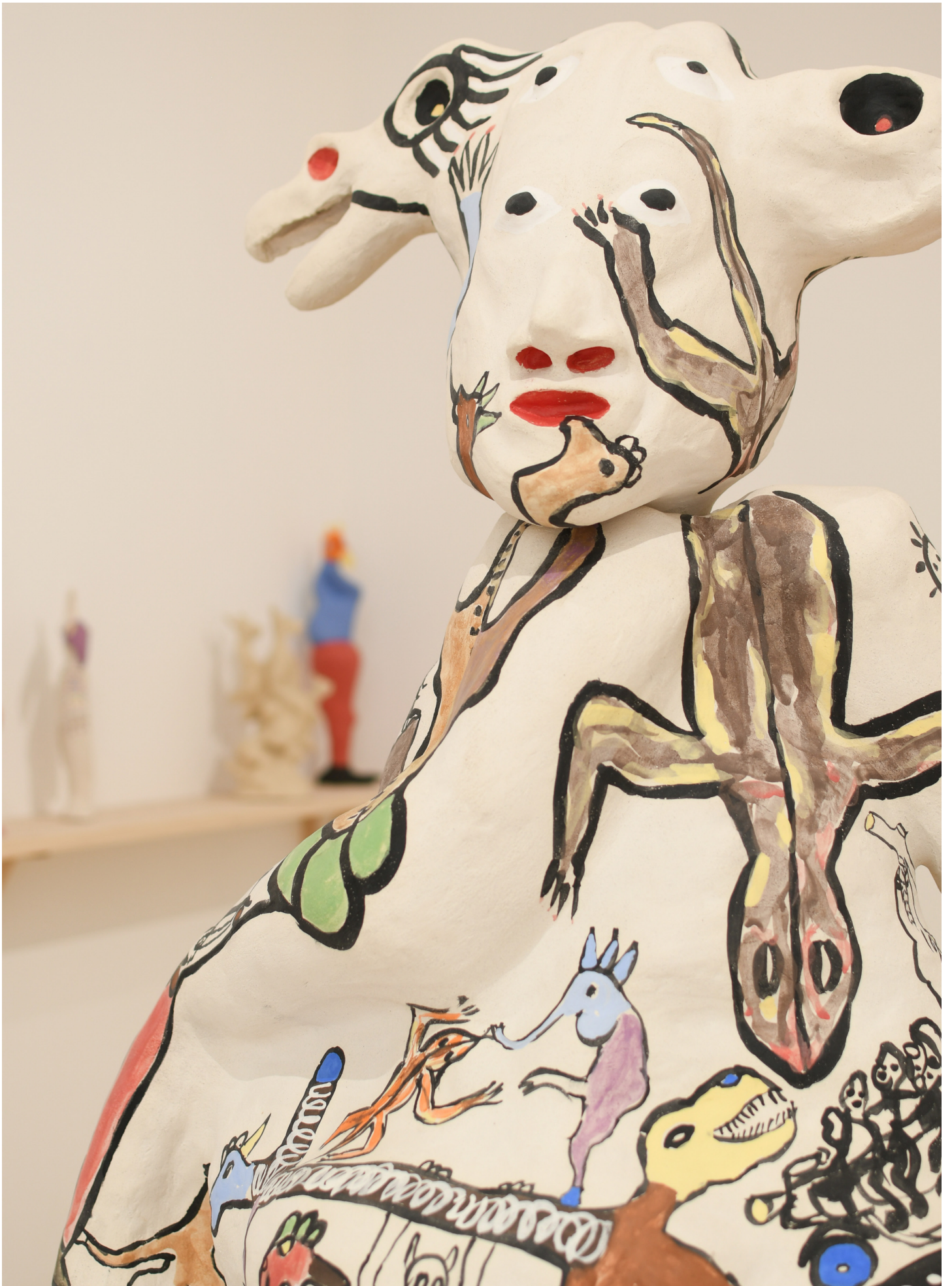
Détail de la sculpture Le traversé, Benjamin Deguenon Grés basse température, engobe, email 175x125x103 cm du 28 juin au 31 août 2024, Terrail, espace de céramique et art contemporain à Vallauris