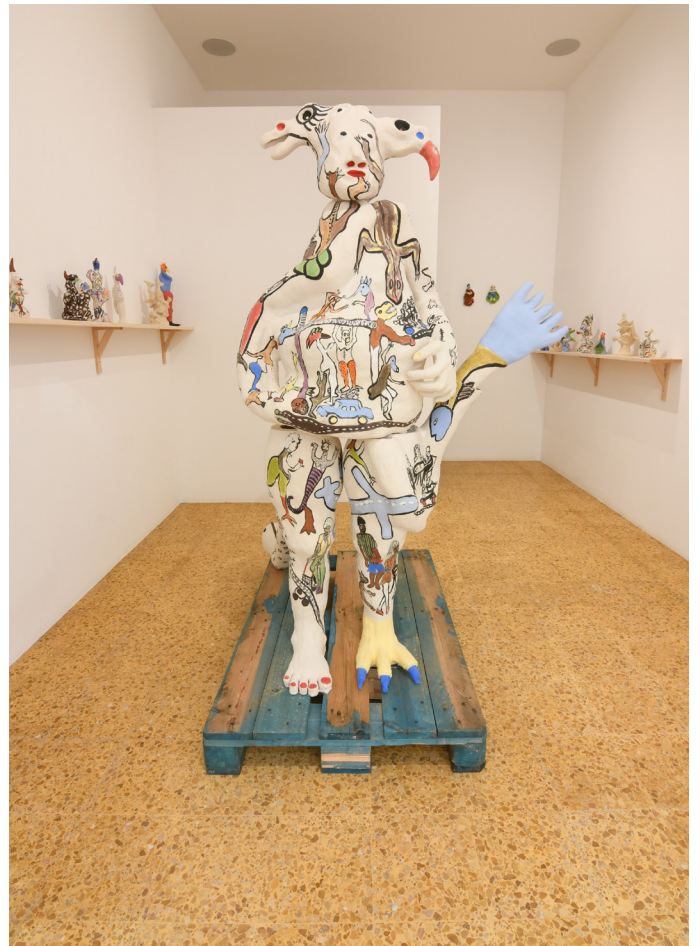
Vue de l'exposition

Interbreeding, the transcendency of living beings, the place of man, and the desire for emancipation are the marks that, year after year, leave oppression on the soul of a people. From fantasy to hyperrealism, from allegory to tragedy, I explore a new medium whilst at the same time I imagine my drawings through the creation of ceramics. This immersion is for me a way to explore the new world of clay. This exhibition at Terrail is the result of my experiences.