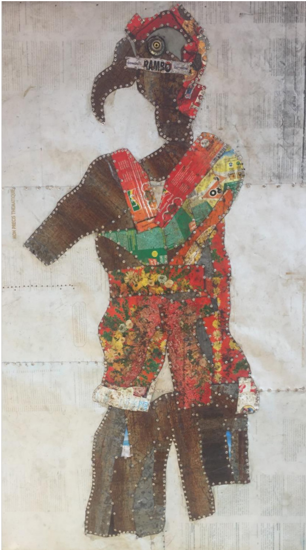
Handicapé - acrylique, pastel fusain, pigment sur papier toile - 100x150cm. 2018