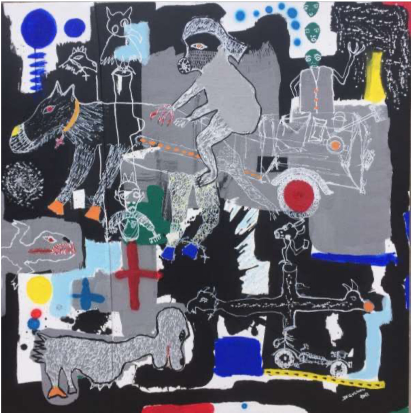
Les inséparables - acrylique, Blanco sur toile, faume, pigments - 100 X 100 cm. 2021