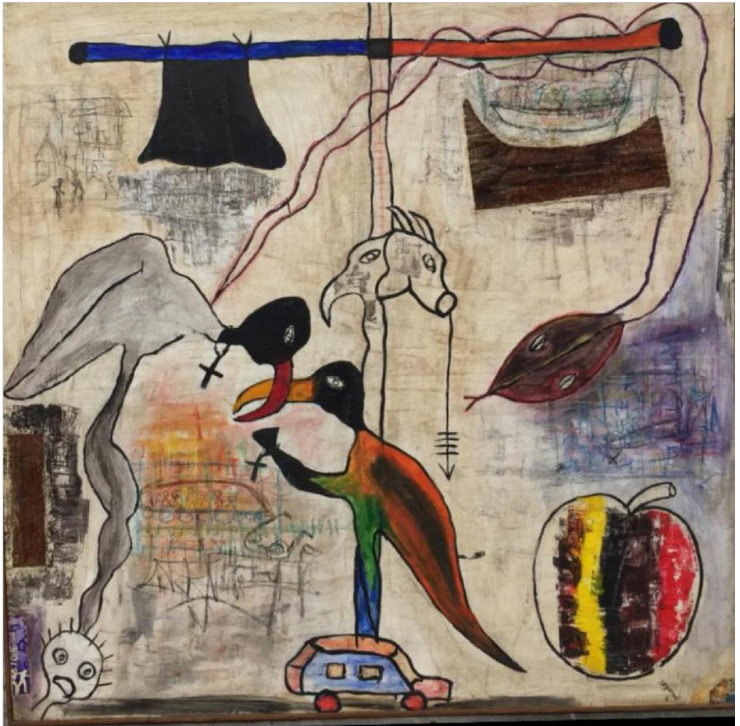
Les amoureux - acrylique, pastel fusain, pigment sur papier toile - 150x150cm. 2015 Collection Louis de Strycker