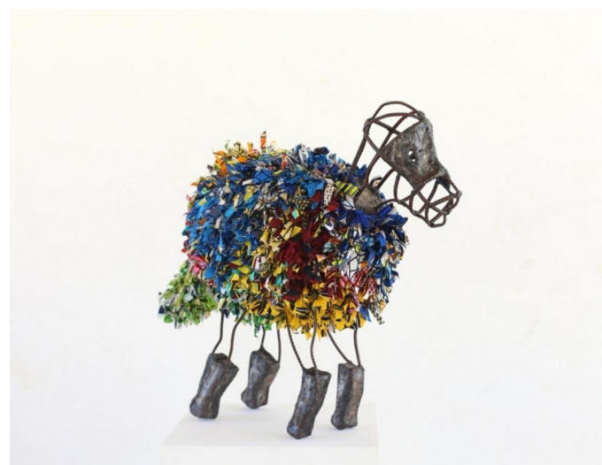
1. Photo de Benjamin Deguenon