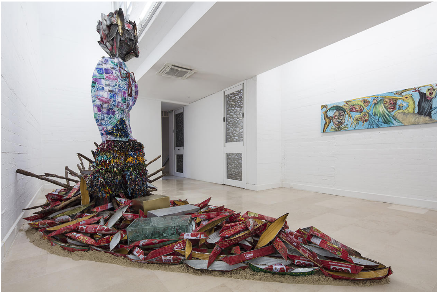
Vue d'exposition : Stop Ma Pa Ta (Ma matière première n'est pas ta matière) - Métal, objets de récupération - 270 x 210 x 400 cm. 2015