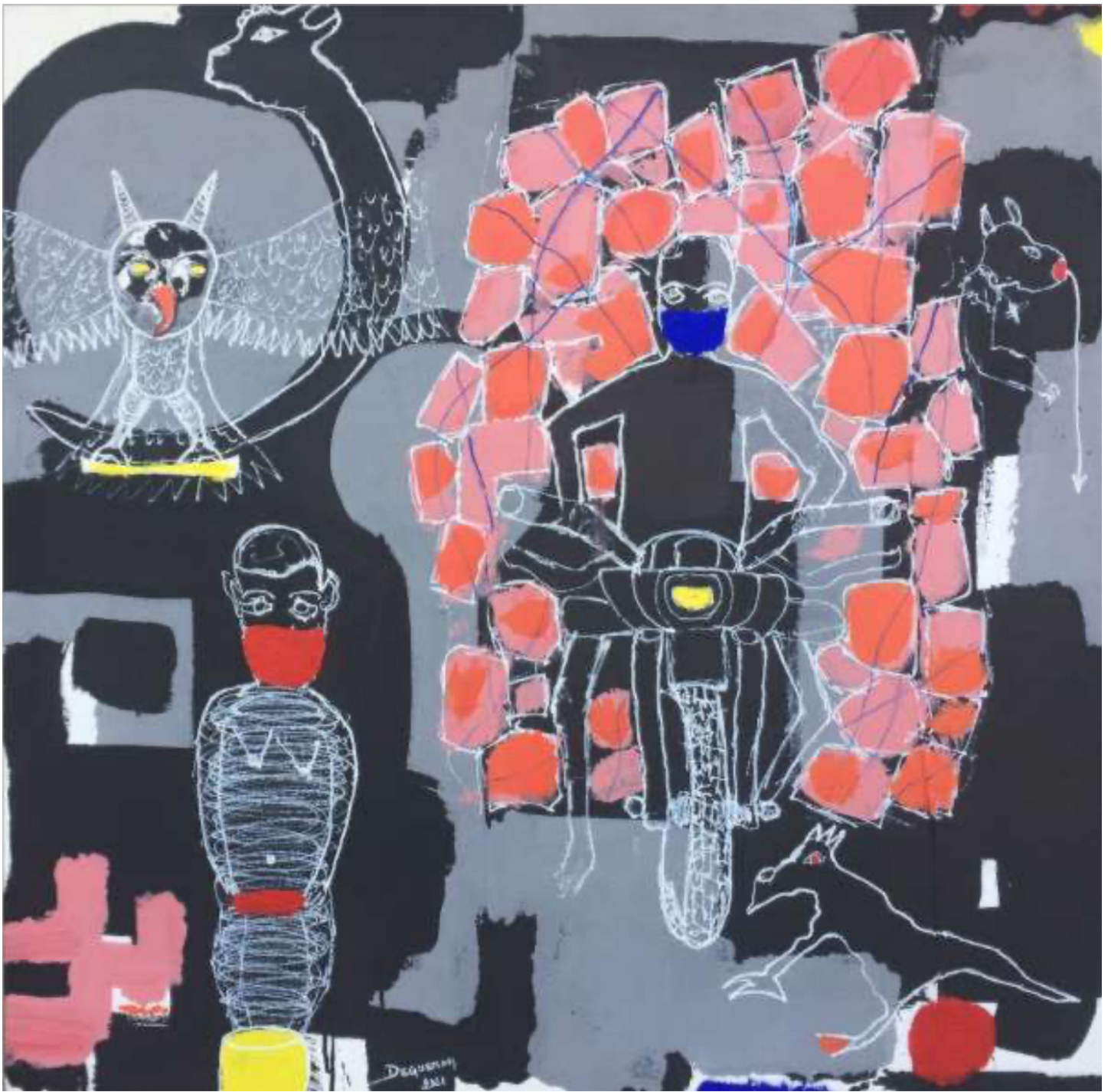
Le débrouillard - acrylique, Blanco sur toile, faume, pigments - 100 X 100 cm. 2021