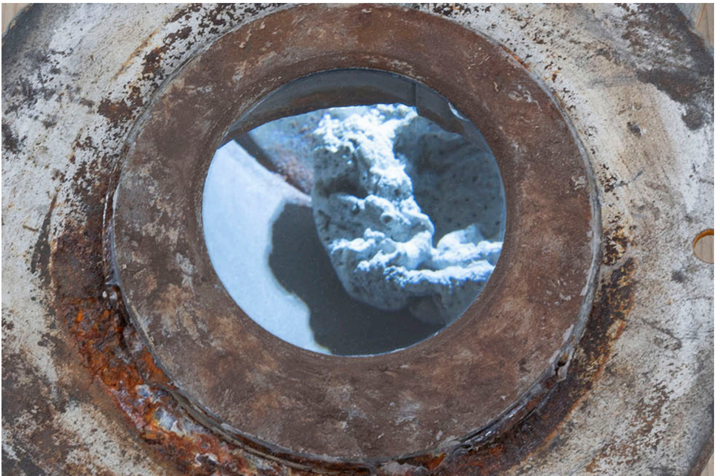
1. Gutters, 2017, Vue de l'installation 2. Gutters, 2017, détail